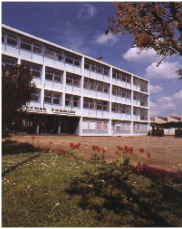
LYCEE JOSEPH FOURIER